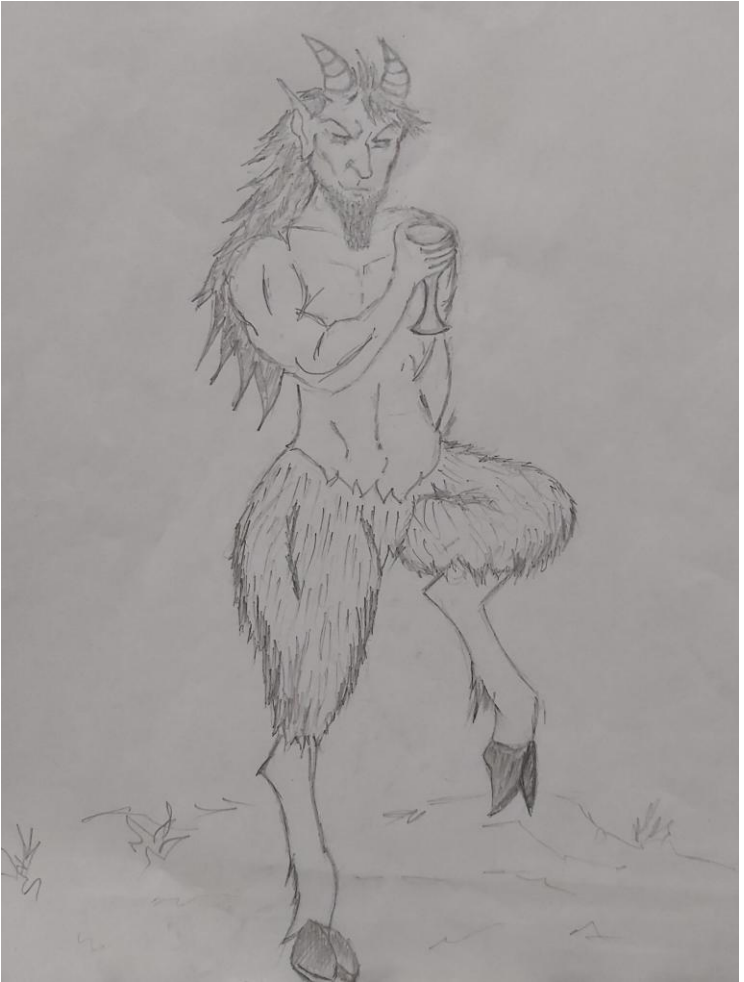
„Satirul cu potir” Desen în creion; autor: Mădălina Cocei